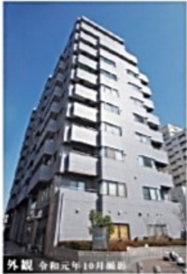
外観 令和元年10月撮影