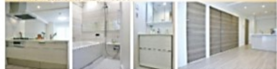
建具:ヨーロッパアンウォールナット柄 / 床:オーク柄(パールグレー)

Natural style 淡い色のフローリングにベージュと白を基調とした 設備を導入し、どんなライフスタイルにも合う仕様。 ※キッチンの設備に一部相違があります。