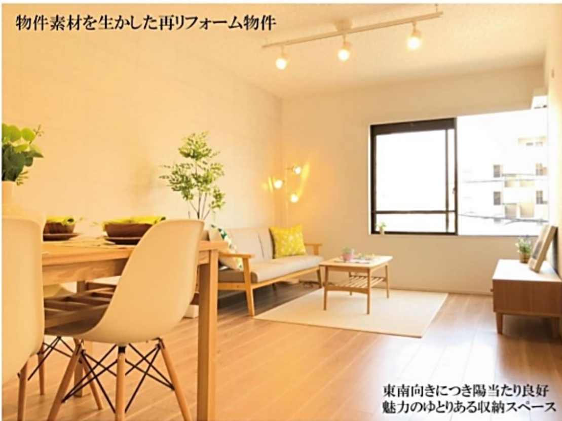
東南向きにつき陽当たり良好 魅力のゆとりある収納スペース